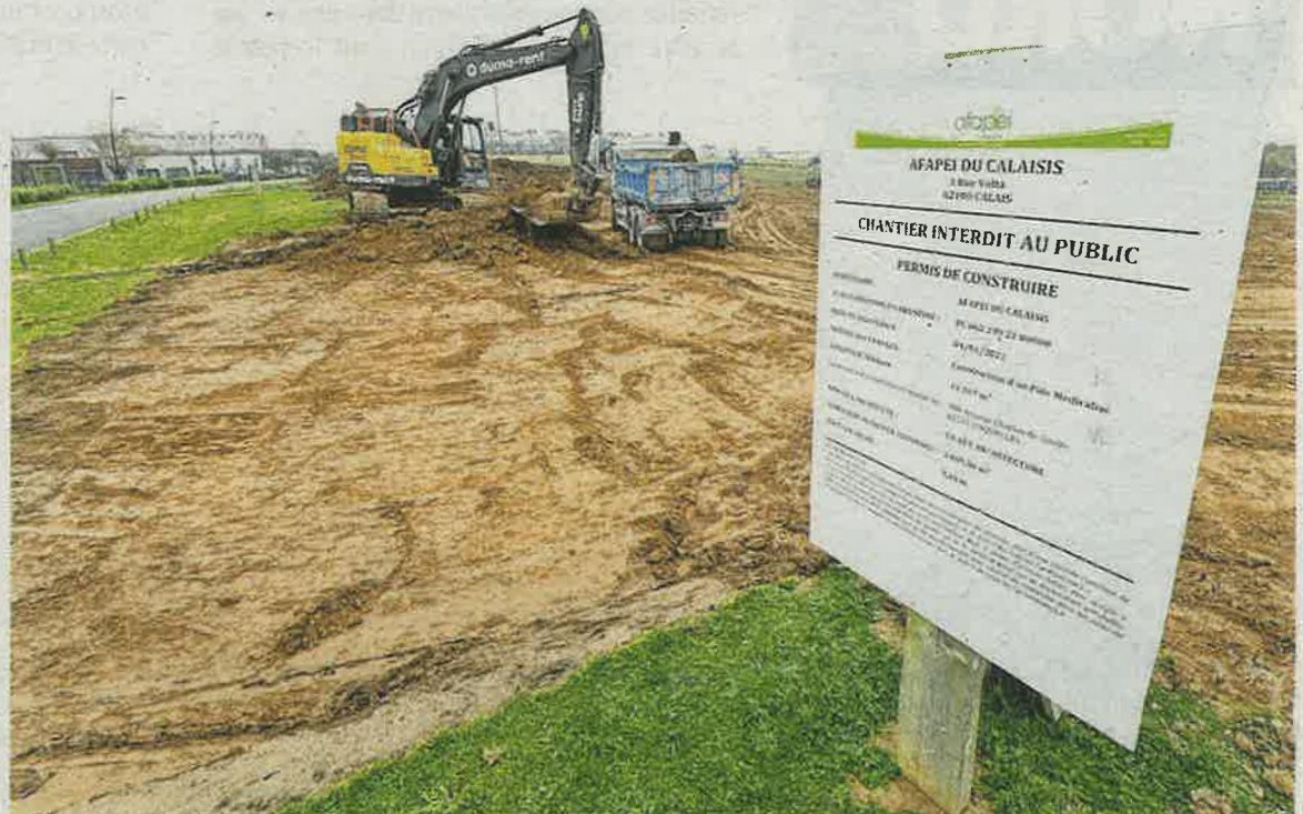
Les travaux commencent à peine zone des Terrasses à Coquelles.

À la faveur de ce futur déménagement, le pôle médicalisé va s'agrandir, passant de 35 à